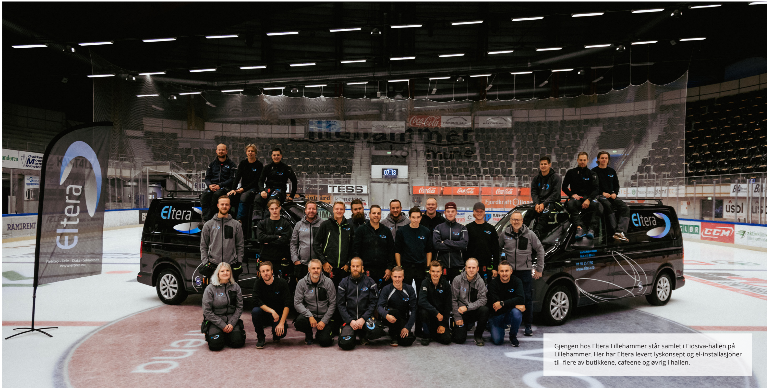
Gjengen hos Eltera Lillehammer står samlet i Eidsiva-hallen på Lillehammer. Her har Eltera levert lyskonsept og el-installasjoner til flere av butikkene, cafeene og øvrig i hallen.

Vi setter vår ære i å levere etter, og helst over, forventningene kundene våre har til pris, tidsramme og kvalitet – uansett størrelse på oppdraget eller hvem oppdragsgiveren er.